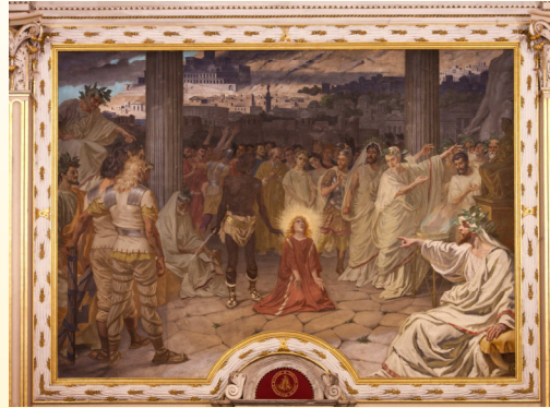
Decapitazione di S. Agapito, Cattedrale di S. Agapito