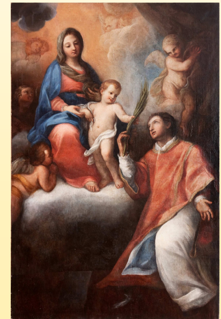
Madonna e S. Cesareo (Museo Diocesano Prenestino d'Arte Sacra)