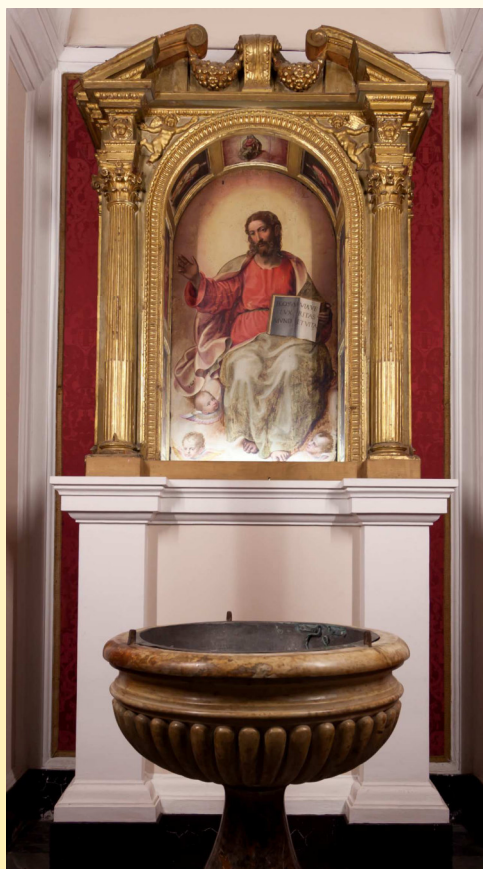
Battistero della Cattedrale di S. Agapito con tavola del "Gesù Salvatore" di G. Siciolante.