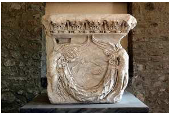
Ara delle Vittorie (Museo Diocesano Prenestino di Arte Sacra)