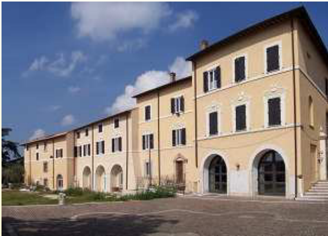
Museo Diocesano Prenestino e Palazzo Vescovile visti dal Piazzale Eduardo Davino

L'Ufficio Catechistico Diocesano e il Museo Diocesano Prenestino di Arte Sacra propongono degli itinerari di catechesi attraverso l'osservazione delle opere d'arte presenti nel nostro territorio conservate nel Museo Diocesano e mediante la visita alla Basilica Cattedrale di Sant' Agapito.